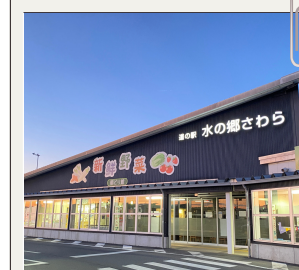
② 道の駅水の郷さわら

香取市佐原イ3981-2 香取市の特産品が揃った直売所。 生鮮品のほか加工品も豊富に取り揃え ています。